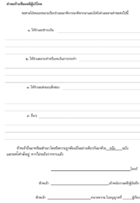
รูปที่ 3 (5)คำฟ้องท้ายคำฟ้องคดีแพ่ง (ใช้สำหรับคดีแพ่งสามัญและคดีมโนสาเร่)